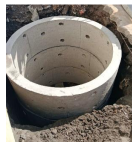
Gambar 3. Pembangunan Resapan

Implementasi etika dilakukan dengan menjaga komunikasi yang transparan dan jujur antar klien, kontraktor serta pekerja. Hal ini dapat ditunjukkan dengan adanya pembangunan resapan, yang diusulkan oleh supervisor dikarenakan belum ada akses pembuangan limbah air ke saluran kota. Pada kasus ini penulis sudah mengusulkan untuk pembuatan resapan sebanyak 2 buah, tetapi yang disetujui oleh pihak developer hanya 1 resapan saja sehingga penulis hanya membangun 1 resapan.