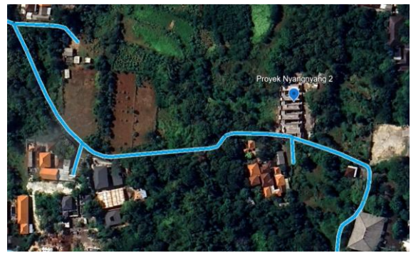
Gambar 2. Lokasi Proyek

Penelitian ini menggunakan proyek pembangunan villa di daerah Pecatu, Kuta Selatan, Kabupaten Badung, Bali. Ukuran Area proyek ini seluas 996,45 m 2 .