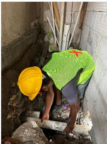
Gambar 5. Tukang MEP

Pengerjaan penambahan resapan dilakukan oleh pekerja menggunakan APD yang sesuai dan pemantauan kondisi lingkungan kerja yang aman.