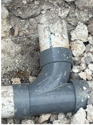
Gambar 4. Pipa kelas AW

Pekerjaan harus sesuai dengan keahlian, material yang digunakan memenuhi standar, dan memastikan kualitas pekerjaan baik. Ini dapat dilihat dari gambar 4 dimana menggunakan pipa kelas AW untuk saluran pembuangan ke resapan.